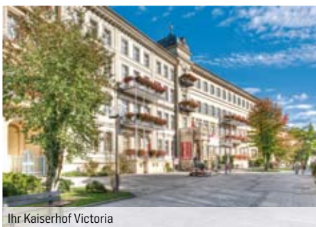
Ihr Kaiserhof Victoria

Hotelbeschreibung: Das unter Denkmalschutz stehende Haus aus dem Jahre 1840 wurde 2009 neu eröffnet und erwartet Sie mit Rezeption, Lift, Lobby-Halle, Bar, À-la-carte-Restaurant, Internet-ecke, kostenfreiem WLAN und Terrasse.