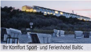
Ihr Komfort Sport- und Ferienhotel Baltic