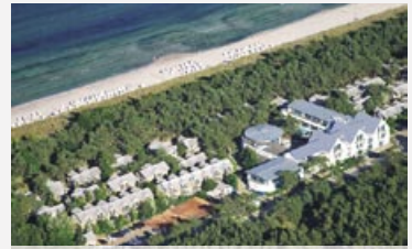
Ihre 4-Sterne Strandresidenz AQUAMARIS