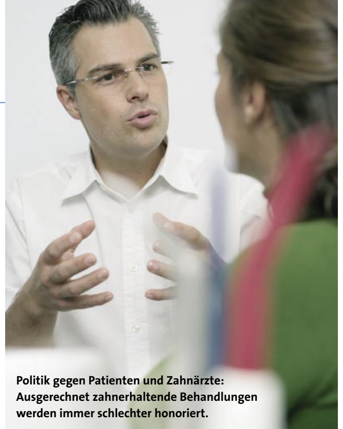
Politik gegen Patienten und Zahnärzte: Ausgerechnet zahnerhaltende Behandlungen werden immer schlechter honoriert.