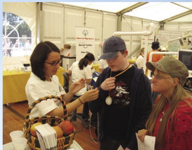
Medaille der etwas anderen Art: Für Mut und Tapferkeit beim Zahnarzt wurden die Sportler ausgezeichnet.

Fußball bis hin zu Judo, Tennis und Leichtathletik. Und nie zuvor begeisterte ein so vielfältiges und buntes Rahmenprogramm die Besucher. Vor allem die Atmosphäre bei der Eröffnungsfeier in der Bremen Arena stand der bei einer großen Olympiade in nichts nach.