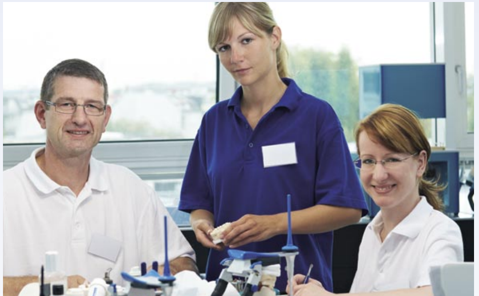
Teamwork in der Praxis: Die niedergelassenen Zahnärzte sind ein Garant für sichere Arbeitsplätze.

Die Unterstützung durch Zahnmedizinische Fachangestellte, wie die „Helferinnen“ richtig heißen, braucht der Zahnarzt nicht nur während der Behandlung, sondern bei der gesamten Betriebsführung. Dazu gehören unter anderem organisatorische Aufgaben, das Führen der Patientenkartei, Terminvergabe, Abrechnung, Buchhaltung, Materialbeschaffung sowie die Pflege der Geräte und Instrumente. Viele Zahnärzte beschäftigen nicht nur meh-